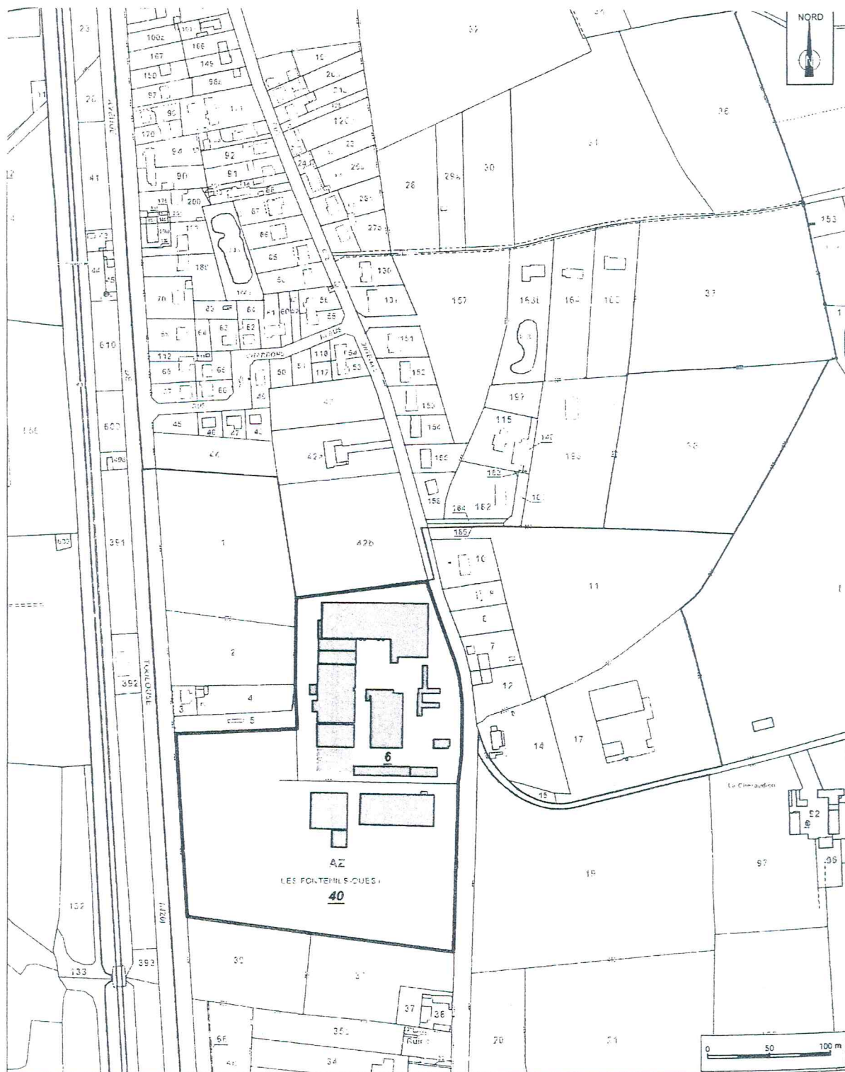
PARCELLES CONCERNÉES PAR LA DEMANDE DE SERVITUDES D'UTILITE PUBLIQUE N°1 (RESTRICTION D'USAGE DES TERRAINS)

Légende ——— Limites de la zone de servitude n°1 proposée