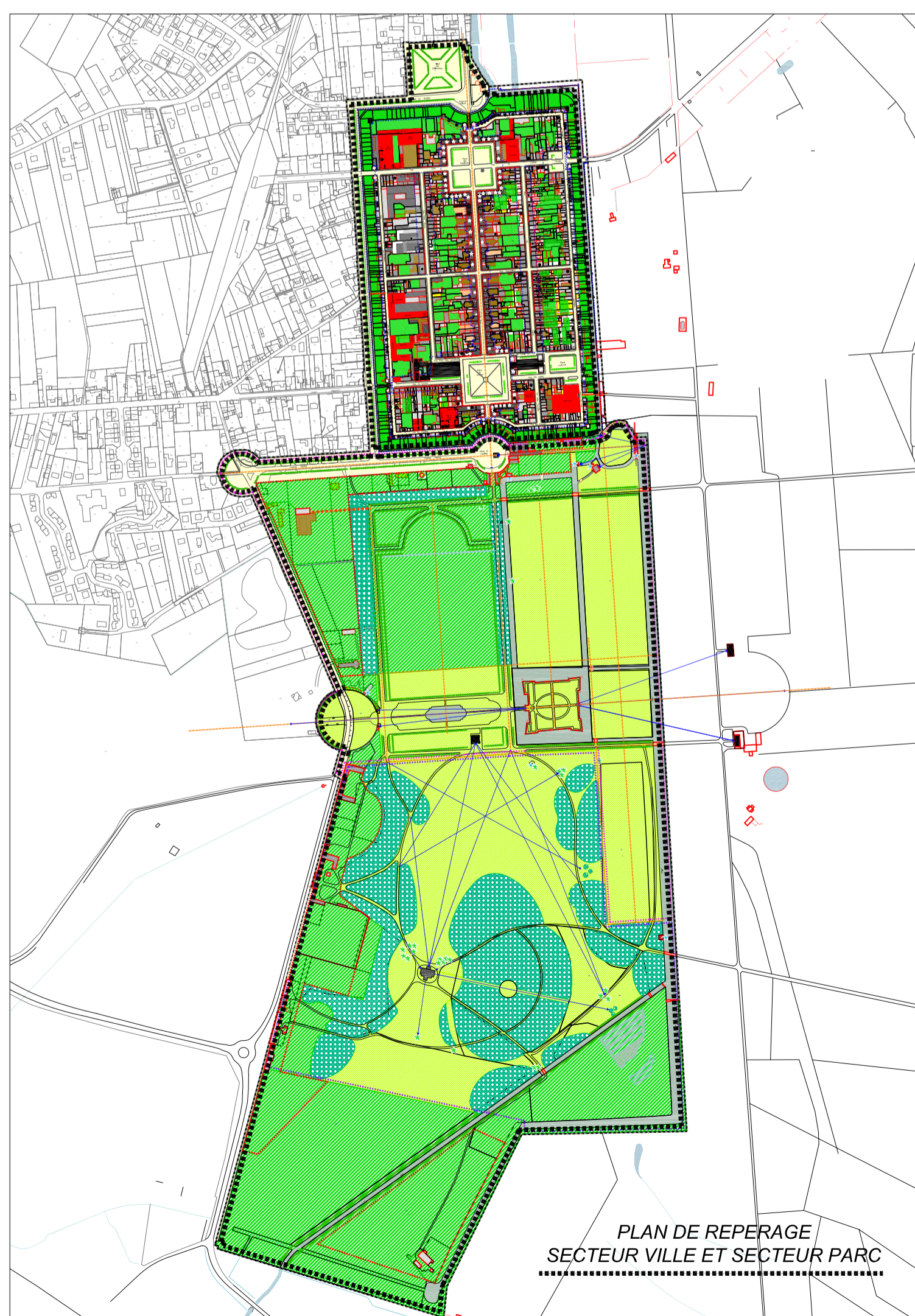
PLAN DE REPERAGE SECTEUR VILLE ET SECTEUR PARC