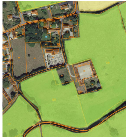
Le jardin Boosquain / Chouain