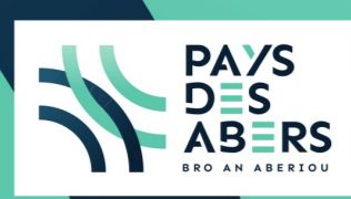
Planche 1 PLUi approuvée le : 30 janvier 2020 Modification n°1 du PLUi - approuvée le : 23 juin 2022 Révisions allégées n°1, n°2 et n°3 du PLUi - approuvées le : 22 février 2024 Modification n°2 du PLUi - approuvée le : 27 juin 2024

COMMUNAUTÉ DE COMMUNES DU PAYS DES ABERS