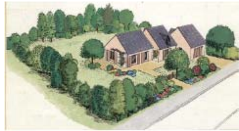
... préférer une haie panachée d'essences champêtres locales noyant le grillage de protection.