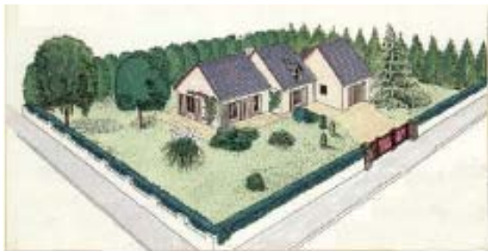
Plutôt qu'une haie monospécifique uniforme sur muret ...