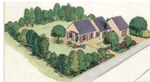
... préférer une haie panachée d'essences champêtres locales noyant le grillage de protection.

La liste d'essences sera adaptée à la fonction (ou aux fonctions) souhaitée pour la haie (brise vent, brise vue, décorative, fruitière, etc...).