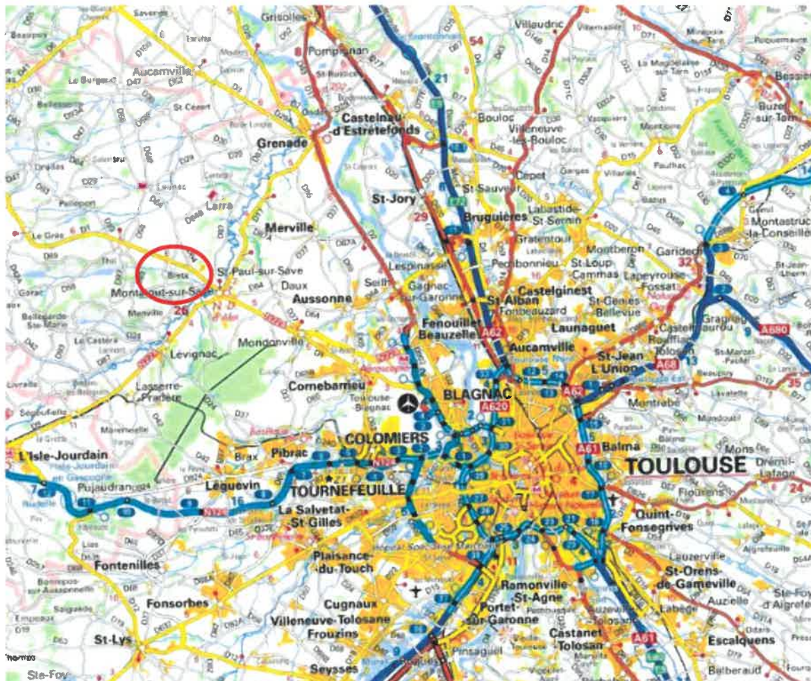
Carte de localisation de la commune

La commune de Bretx se situe dans le département de la Haute-Garonne, en région Occitanie. Localisé à une vingtaine de kilomètre au Nord-Ouest du centre de Toulouse, Bretx comporte 673 habitants (2018) pour une superficie de 8,41 km 2 .