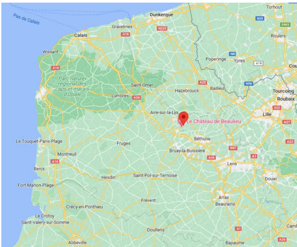
1- Localisation de Labourse dans la région Hauts de France

Labourse est une commune située en région Hauts-de-France et dans le département du Pas-de-Calais. Elle relève de l'arrondissement de Béthune et du canton de Nœux-les-Mines.