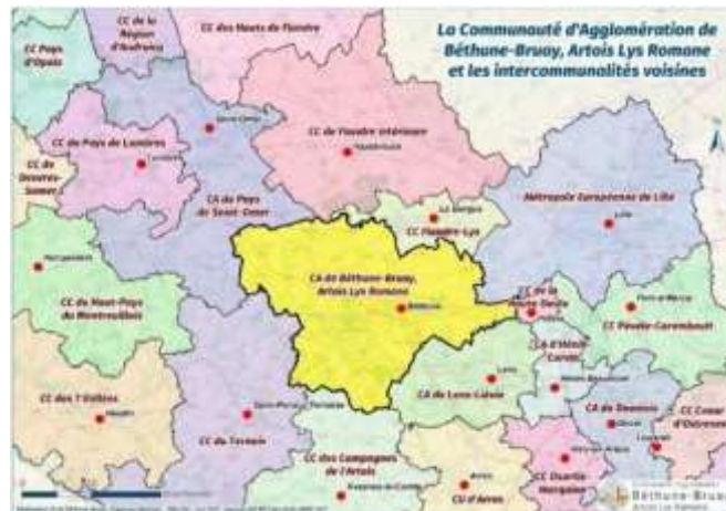
La Communauté d’Agglomération Béthune-Bruay et les intercommunalités voisines

Labourse fait partie de la Communauté d’Agglomération Béthune-Bruay, Artois Lys Romane (CABBALR), structure intercommunale créée le 1 er janvier 2017 par fusion de trois EPCI : la Communauté d’agglomération Béthune Bruay, Nœux et Environs, la Communauté de Communes Artois Lys et la Communauté de Communes Artois Flandres. La CABBALR est compétente en matière de plan local d’urbanisme depuis sa création.