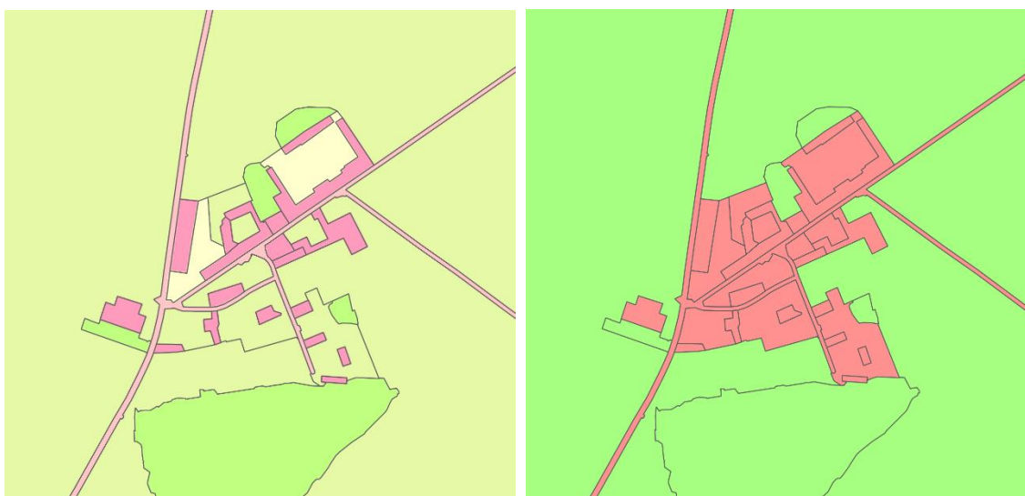
Couches couverture de l'OCS GE (à gauche) dont les géométries sont identiques à couche d'artificialisation correspondante.